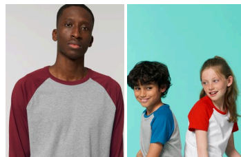
Catcher Long Sleeve Mini Catcher Short Sleeve